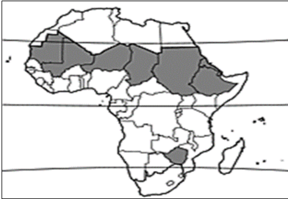
Figure 2 : Répartition de la roquette cultivée dans quelques pays d'Afrique (zones grises)