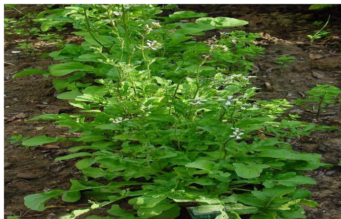
Figure 3 : Eruca vesicaria sativa d'Algérie (Fl. Algérie [Quéze & Santa] (1962).)