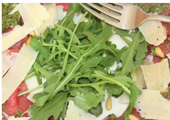
Figure 4 : Roquette en salade (Chauvet, Michel, 2018)

En Égypte, la roquette est couramment consommée au petit déjeuner, dans un ragoût de fèves